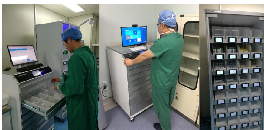
阜外华中心血管病医院手术室毒麻药品解决方案