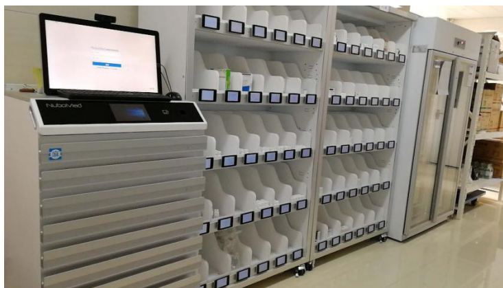
阜外华中心血病医院门急诊药房解决方案